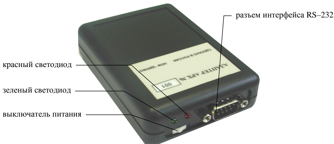
Рис. 1 – Внешний вид адаптера APX

На рис. 1 изображен внешний вид адаптера APX.