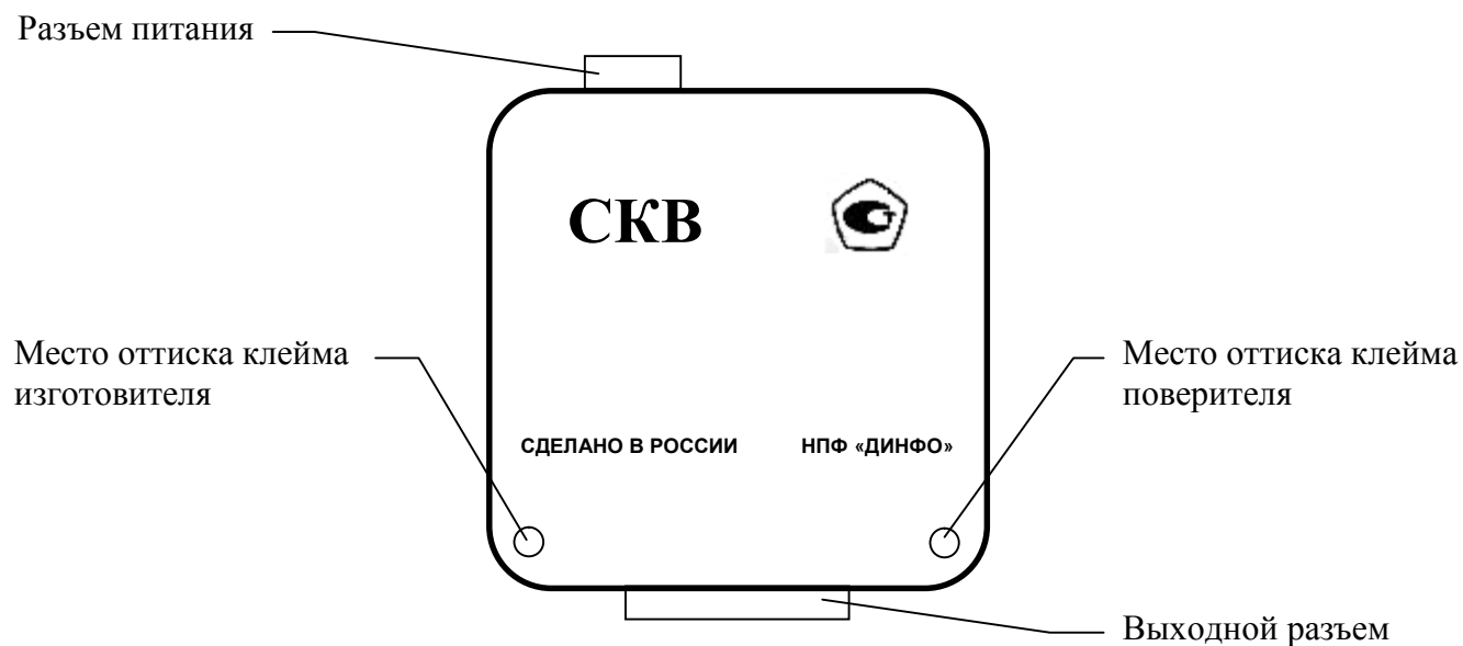
Рисунок 2 – Схема нанесения оттисков клейма на измерительный блок

Схемы нанесения оттисков клейма на измерительный блок и блок питания калибраторов СКВ приведены на рисунках 2, 3 соответственно.