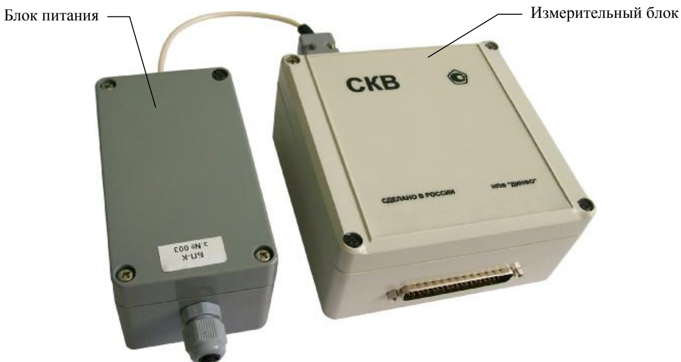
Рисунок 1 – Общий вид калибраторов СКВ

В зависимости от пределов допускаемых относительных погрешностей мер существуют три класса калибраторов СКВ, метрологические характеристики которых приведены в таблице 1.