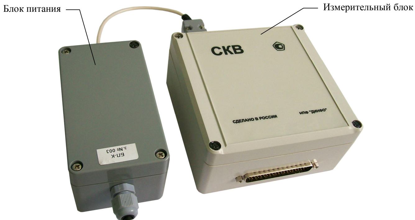
Рисунок 1 – Общий вид калибраторов СКВ

В зависимости от пределов допускаемых относительных погрешностей мер существуют три класса калибраторов СКВ, метрологические характеристики которых приведены в таблице 1.